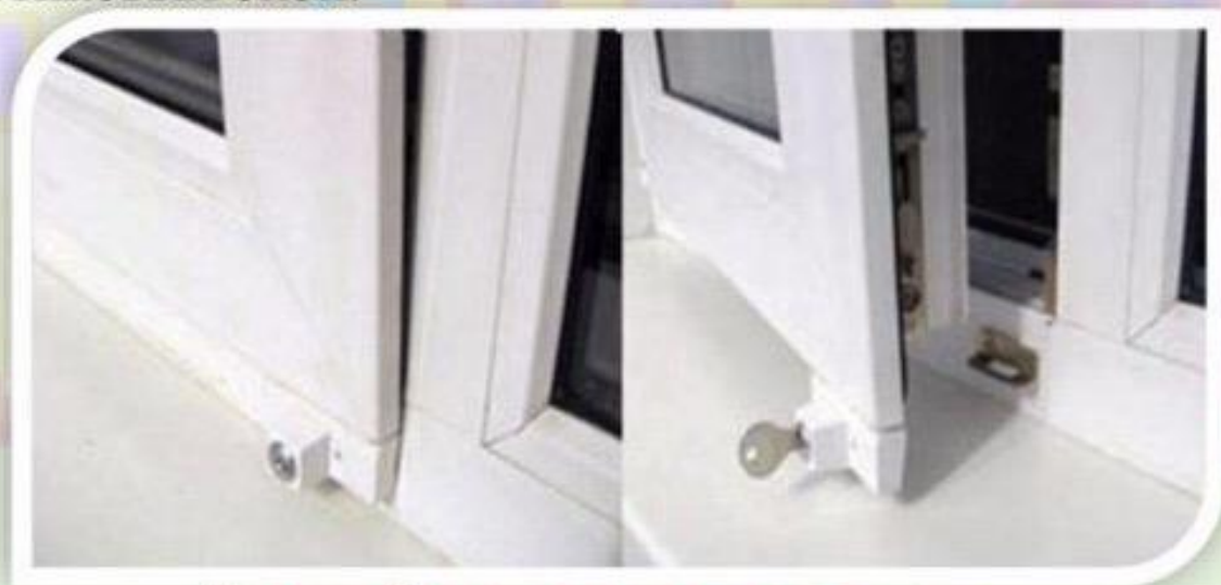
Замок блокировщик с ключом

Можно воспользоваться специальными замками блокираторами, которые предлагают установщики пластиковых окон.